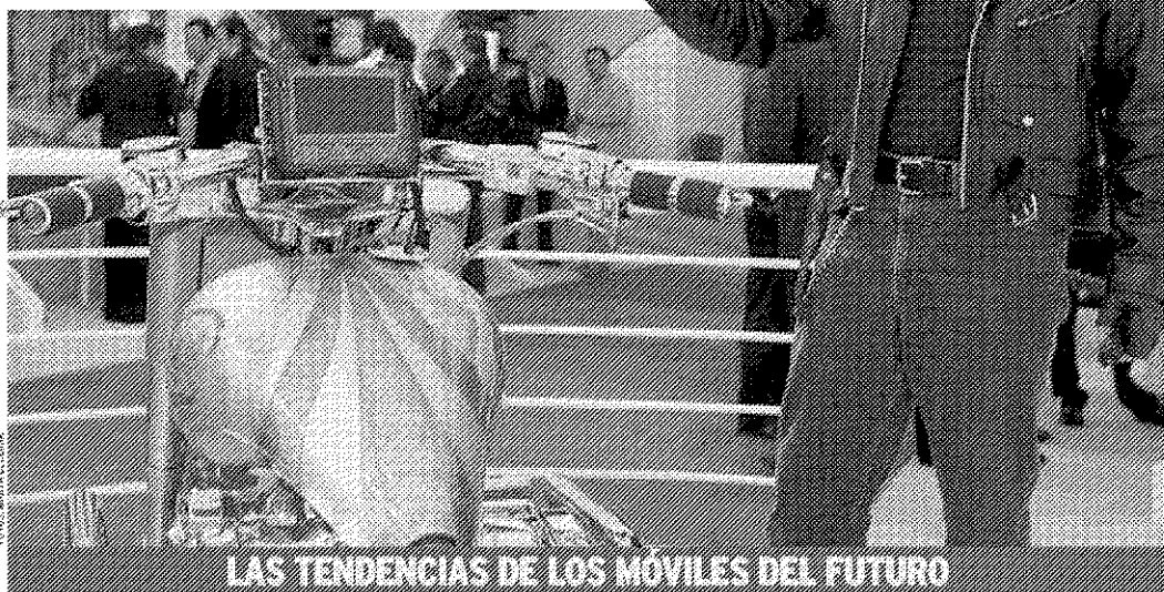
LAS TENDENCIAS DE LOS MÓVILES DEL FUTURO

La telefonía móvil va sobre ruedas. Y no sólo porque el año pasado se vendieron 1.200 millones de terminales en todo el mundo, sino porque ahora incluso las motos se apuntan a la tecnología más puntera. El Mobile World Congress, el encuentro más importante del sector a escala internacional que ayer se inauguró en Barcelona, ya ha presentado algunas de sus apuestas más transgresoras. Es el caso de Intel, que acaparó numerosos flashes con una moto que lleva un ordenador incorporado con el que es posible llamar, disponer de GPS, navegar por internet o prescindir de espejos, ya que incorpora cámaras